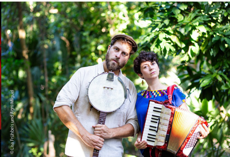
© Lisa Frühbeis und Agni Miguel

Doppelkonzert TANTE FRIEDL UND JENNY THIELE Folk meets Pop Fr., 10.11.2023 | 20 Uhr VVK 20 €/AK 22 €/erm. 11 €